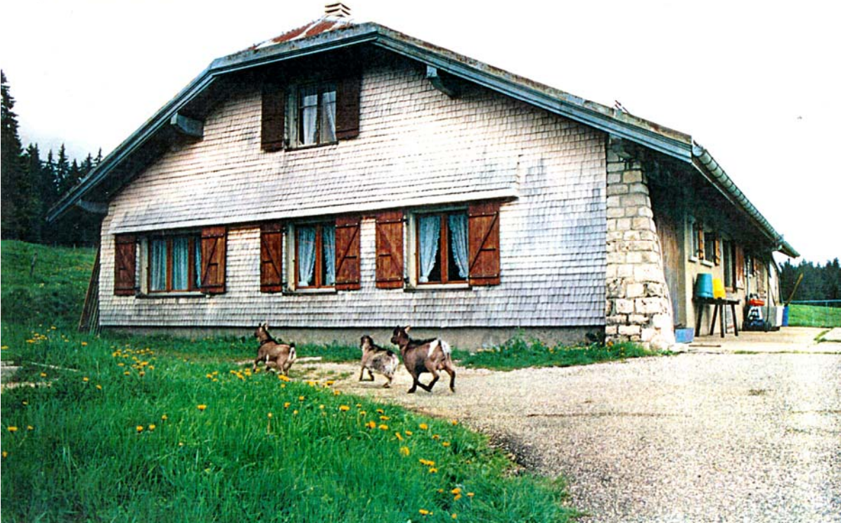
Le Chalet des Grands Buissons en 1995.