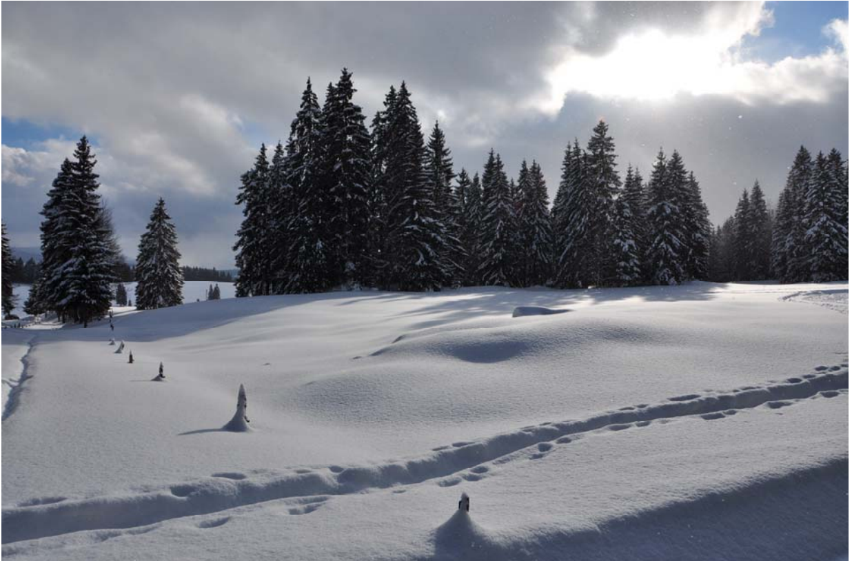
Cette même piste de fond passe à l'arrière des Grands Buissons. Paysage discret mais splendide quand il est ainsi enneigé. On est hors du temps.